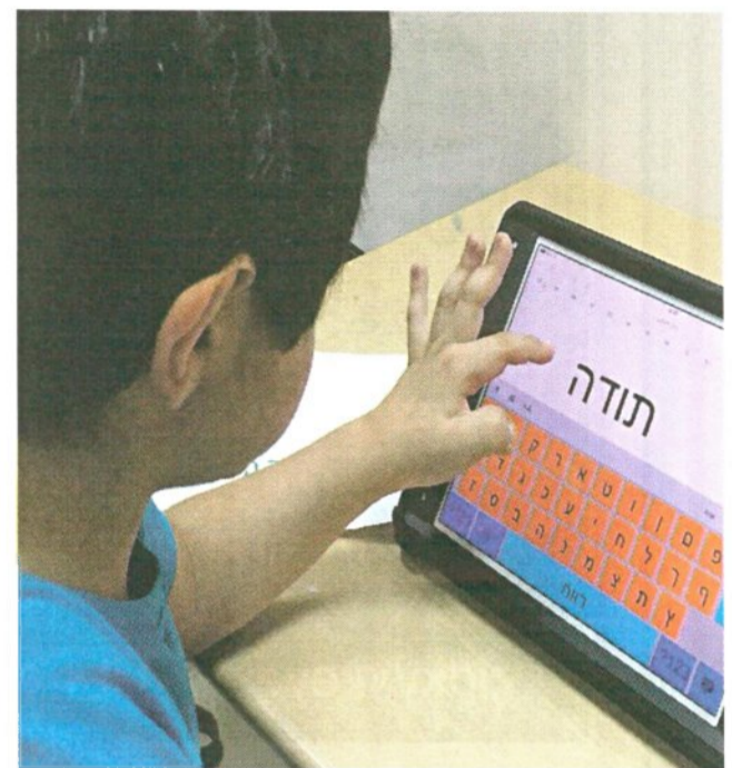
מקלדת IssieBoard - צבעי המקשים מקלים על ההקלדה