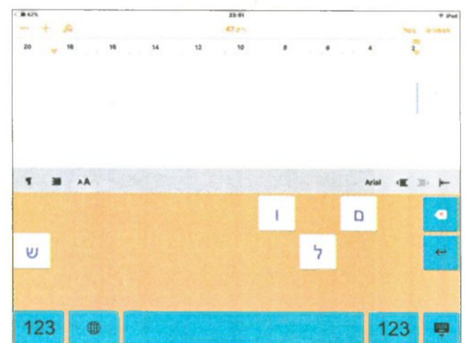
מקלדת עם אותיות מסוימות בלבד