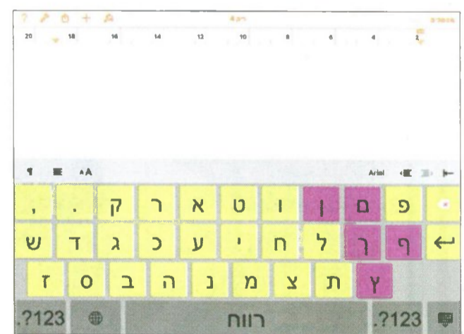
מקלדת בה אותיות הסופיות מובלטות