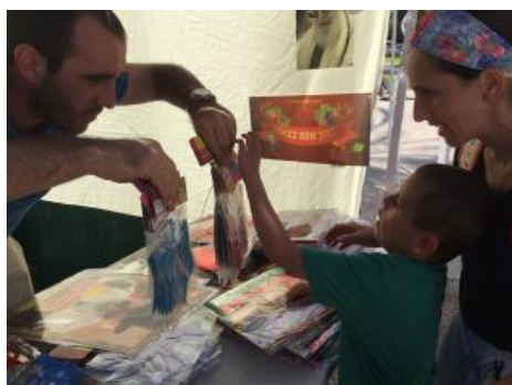
שוק ארבעת המינים