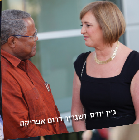
ג'ין יודס ושגריר דרום אפריקה