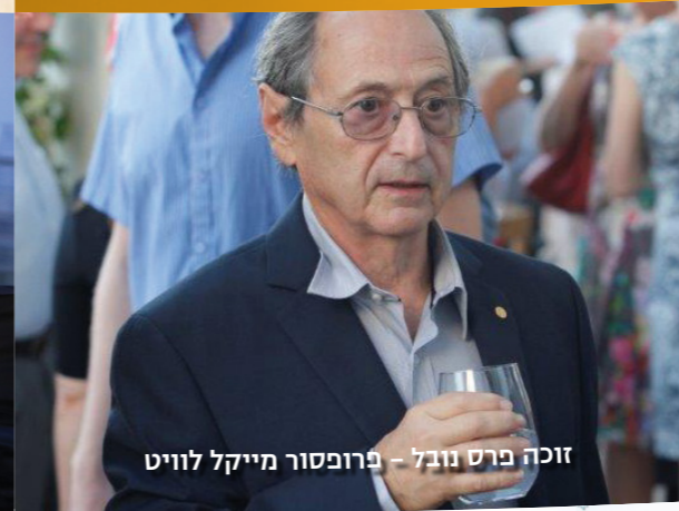
זוכה פרס נובל - פרופסור מייקל לוויט