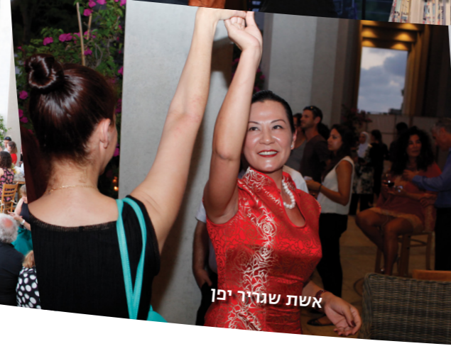
אשת שגריר יפן